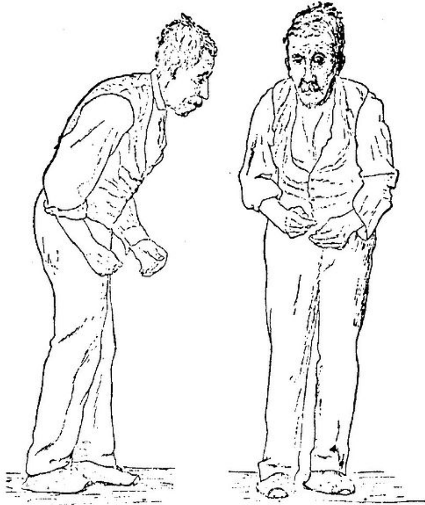
Sir William Richard Gowers Parkinson Disease sketch 1886